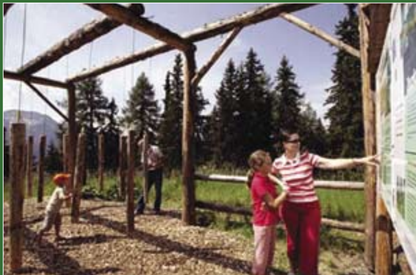
Ein Teil des Lernpfades in Sachen Wald

Ein Lernpfad zwischen Bettmeralp und Betten gibt Auskunft über die wichtigen Funktionen des Bergwaldes.